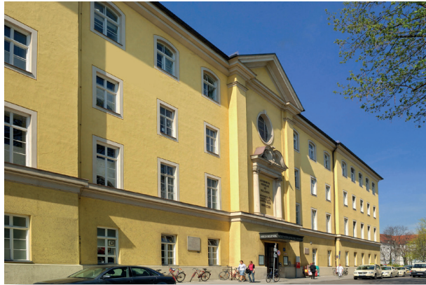
Medizinische Klinik und Poliklinik IV