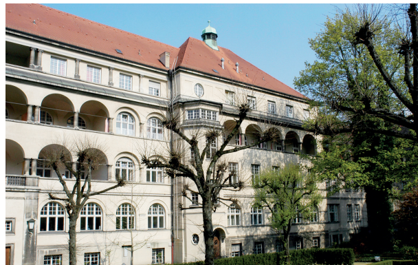
Klinik und Poliklinik für Frauenheilkunde und Geburtshilfe